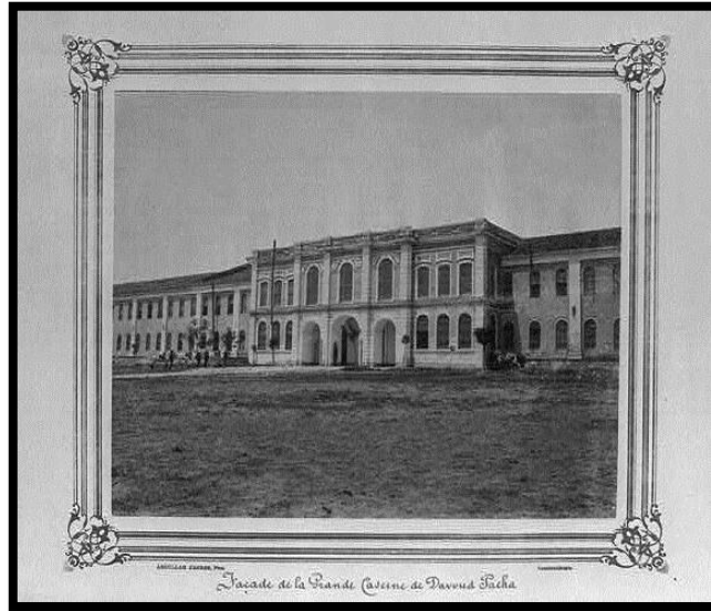
Şekil 2. Tarihi Davutpaşa Kışlası'nın Giriş Cephesi

Davutpaşa Yerleşkesinin bulunduğu alandaki askeri yerleşimin Bizans Dönemi'ne kadar uzandığı; bölgenin, askeri ve saray törenlerine hizmet eden konumda olduğu; İstanbul'un fethi sırasında da askerin konaklamasına hizmet verdiği ve Fatih Sultan Mehmet'in otağının burada kurulmuş olduğu söylenmektedir. İstanbul'un fethinden, Yeniçeri Ocağı'nın kaldırılmasına kadar geçen zaman diliminde alan, Avrupa'ya sefere çıkan Osmanlı Ordusu'nun toplanma merkezi olarak kullanılmıştır. Ordunun uğurlandığı sahra olan ve bütün dönemlerde askeri amaçlarla kullanılmış bulunan bu bölgenin yerleşim planları, II. Beyazıt'ın Vezir-i Azamı Koca Davut Paşa tarafından yaptırılmış olduğu için burası Davutpaşa Sahrası (daha sonra Davutpaşa Kışlası) olarak anılmıştır (Bknz, Şekil 1, 2).