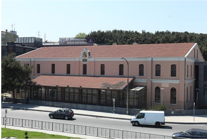
Şekil 6. Tarihi Fırın Binası

Yenilenen A girişi, Fırıncılık Meslek Yüksek Okulu olarak kullanılan Tarihi Fırın Binası'nın yanında olmasından dolayı, yapının gabarisi ve tarihi yapı ile kurduğu silüet ilişkisi açısından Kültür ve Tabiat Varlıkları Koruma Kurulu'nun onayından geçmiştir (Bakınız Şekil 6). Bununla beraber inşa çalışmaları sırasında, altyapı donanımı (doğalgaz hattının deplase edilmesi, yol eğimlerinin büyük araçların kullanımına uygun hale getirilmesi vb.) yenilenmiştir. Yine uygulama aşamasında, üniversitemiz İnşaat Fakültesi, Ulaştırma Anabilim Dalı tarafından araç yolu şerit genişlik ve doğrultuları, dönüş kurpları, durak yerleri ve duraklama cep genişlikleri/boyları hesap edilerek standartlara uygun hale getirilmiştir. Yapının üst kotunu tarihi fırıncılık binasının gabarisi belirlerken alt konutunu altında geçebilecek itfaiye araçların ihtiyaç duyduğu asgari yükseklik belirlemektedir. (min 4,50 m.) Yapının hemen önünde bulunan ve metro durağına direkt bağlantıyı sağlayan yaya köprüsü İ.B.B. tarafından 2018 yılında inşa edilmiştir.