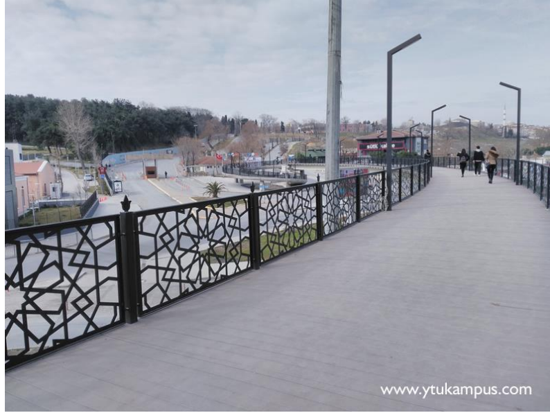
Şekil 3. Yaya köprüsü ve eski giriş kapısı

girişi ve Teknopark girişi olmak üzere üç girişi bulunmaktadır. Bunlardan ilki, bu yarışmaya konu olan Eski Londra Asfaltı ve Dumlupınar Caddelerine açılan ve Davutpaşa metro durağının da bir yaya köprüsü ile bağlandığı A girişidir.