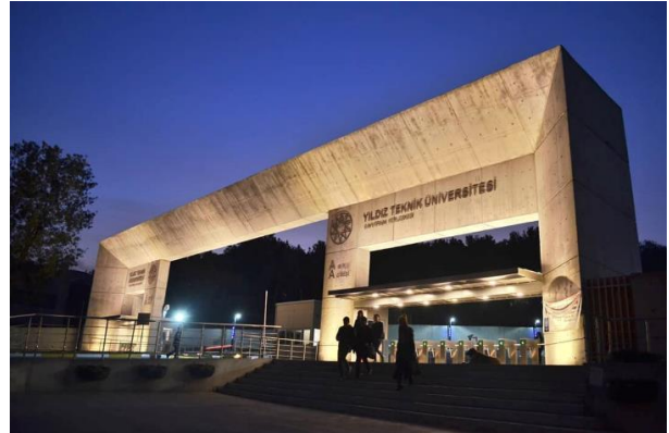
Şekil 4. , Şekil 5. 2019 yılında yenilenen A girişi